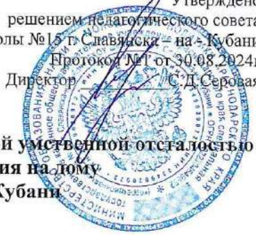
Таблица – сетка часов к учебному плану для обучающихся с умеренной, глубокой умственной отсталостью 10 – 11 классов индивидуального обучения на дому ГКОУ школы №15 г. Славянска-на-Кубани на 2024-2025 учебный год.