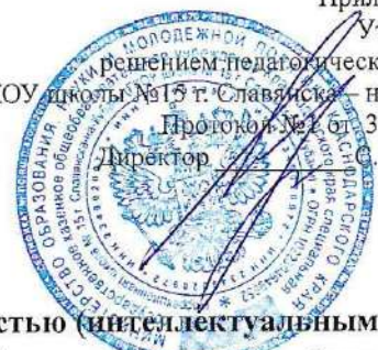
Таблица-сетка часов учебного плана обучающихся с умственной отсталостью (интеллектуальными нарушениями) для 10-11 классов АООП УО (вариант 1) индивидуального обучения на дому ГКОУ школы № 15 г. Славянска-на-Кубани в 2024-2025 учебном году.